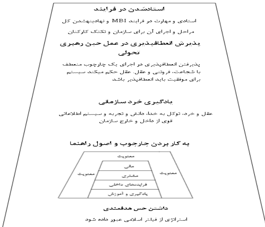
شکل ۲، مدل ترکیبی اولیه مدیریت اسلامی (MBI) و کارت ارزیابی متوازن

چارچوب ترکیبی مدیریت بر مبنای اسلام و کارت ارزیابی متوازن، در شکل شماره ۲ به صورت یک هرم با پنج سطح نشان داده شده است. بنابراین برای اینکه سازمان‌ها از پایین هرم به بالای آن برسند، باید پنج مرحله را بگذرانند (کلامی، ۱۳۹۲، ص ۷۳).