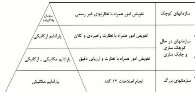
نمودار شماره ۱