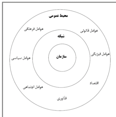
نمودار (۱): محیط عمومی سازمان (هچ، ۱۳۸۵، ص ۱۱۷)

نویسندگان مدیریت تطبیقی دیدگاه‌های عمده در آن را به ترتیب سیر تاریخی ظهور آنها، به پنج دسته کلی تقسیم کرده‌اند. این دیدگاه‌ها عبارتند از: نگرش توسعه اقتصادی، نگرش محیطی، نگرش رفتاری، دیدگاه سیستم باز، و نگرش مبتنی بر فرهنگ (نات، ۱۳۷۱، ص ۱۹؛ اعرابی، ۱۳۷۶، ص ۱۱؛ چن، ۲۰۰۱، ص ۱۲۸). همگام با توجه به نقش فرهنگ به عنوان بخش نرم و تأثیرگذار عوامل محیطی، در مدیریت تطبیقی نیز این عامل نیز از اهمیت بیشتری برخوردار شده است.